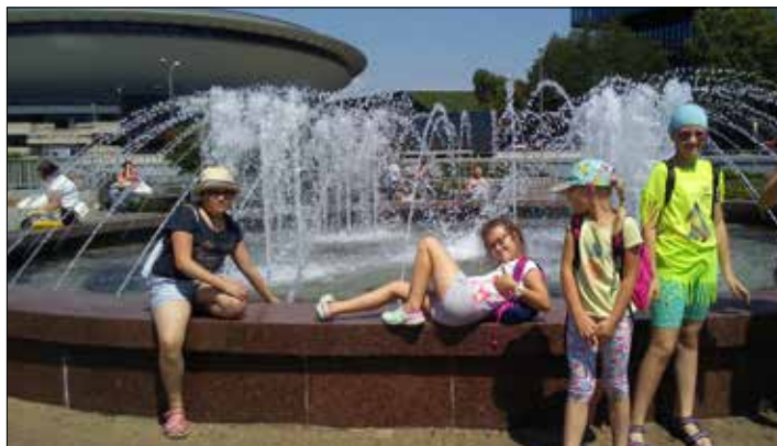
„Józefinka”: podczas wędrowki po Katowicach chłód fontanny koi...