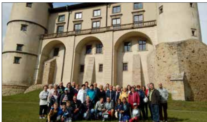
Janowianie przed wiśnickim zamkiem