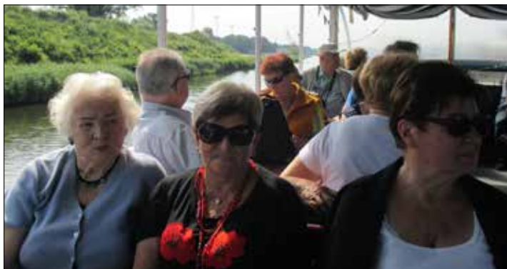
„Juvenia”: wycieczka statkiem po Kanale Gliwickim...