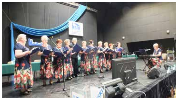
Natomiast „Józefinki” witały przybywających na obrady w drugim dniu