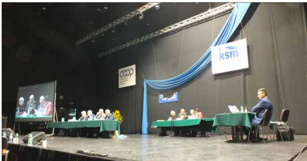
Walne Zgromadzenie KSM w roku 2018

D ostępne do osobistego uczestnictwa wszystkim członkom Katowickiej Spółdzielni Mieszkaniowej demokratyczne obrady Walnego Zgromadzenia były w 2018 roku dwudniowe. Przeprowadzone zostały w poniedziałek 25 i we wtorek 26 czerwca. Rozpoczęły się każdorazowo od godziny 16 30 . Najwyższy organ Spółdzielni obradował, w myśl uchwały Rady Nadzorczej (nr 4/2018 z 8.05.2018 r.), ze względu na potencjalną liczebność uczestników każdej z części, w głównej sali Centrum Kultury Katowice im. Krystyny Bochenek, przy Placu Sejmu Śląskiego w Katowicach. W tej formule – możliwości powszechnego uczestnictwa ogółu członków, a nie tylko Zebrania Przedstawicieli – Walne Zgromadzenie odbywało się po raz siódmy.