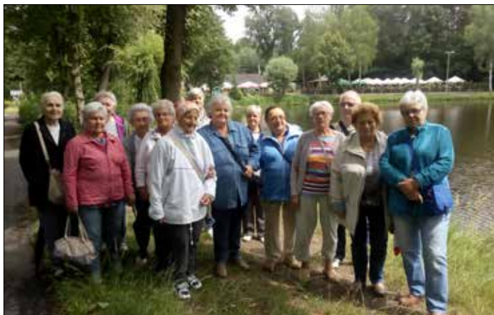
„Trzynastka”: zakończenie działalności sekcji. Spacer nad staw Janina