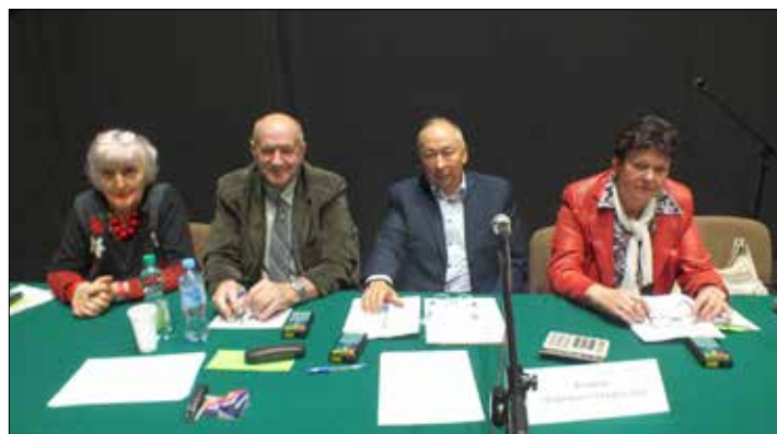
Komisje Mandatowo-Skrutacyjne Walnego Zgromadzenia KSM w pierwszym dniu (z lewej) i w drugim dniu obrad