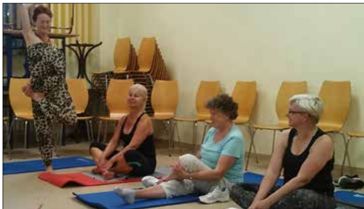
Dzień Jogi w „Józefince”