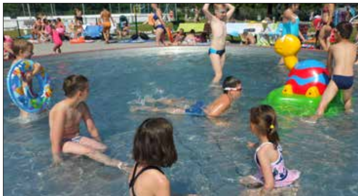
„Józefinka” – woda to nasz żywioł