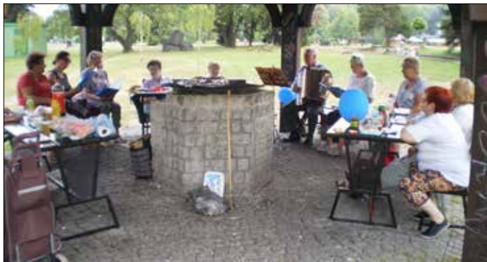
Centrumowcy z piosenką przy ognisku w Parku Śląskim