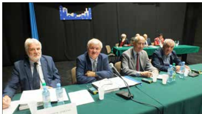
Prezydium Walnego Zgromadzenia KSM w pierwszym dniu (z lewej) i w drugim dniu obrad