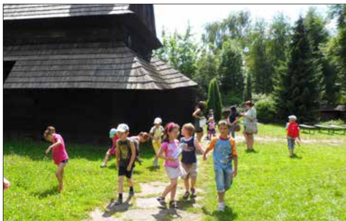
„Józefinka” szukała lata w Parku Śląskim