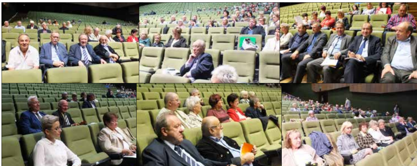
Migawki z sali obrad Walnego Zgromadzenia KSM

Z kolei omawiano „ Sprawozdanie Zarządu z działalności KSM za 2017 rok w tym sprawozdanie finansowe za rok sprawozdawczy ”. Te materiały sprawozdawcze członkom KSM zostały przedstawione trzykrotnie: po raz pierwszy – w formie pisemnej, sporządzonej w okresie przed zakończeniem badania sprawozdania finansowego KSM za 2017 rok przez biegłego rewidenta i dostarczonego członkom i nieczłonkom,