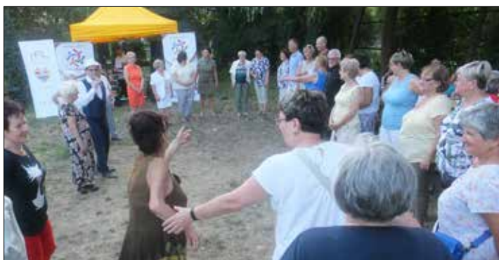
Dzień Sąsiada w „Trzynastce”