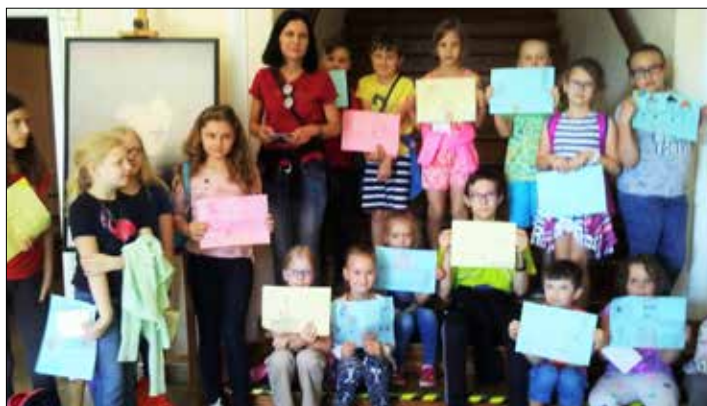
Wakacyjne marzenia prezentują młodzi Józefinkowicze