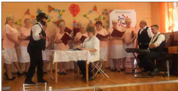
Duże brawa zebrał w „Trzynastce” zespół „Niezapominajka” z Wojkowic Kościelnych