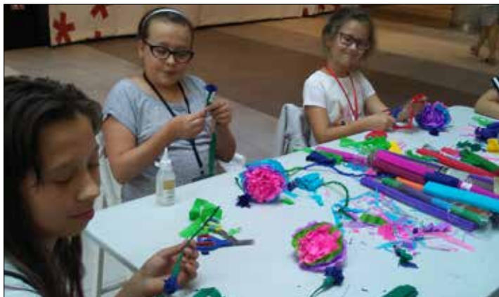
Warsztaty plastyczno-literackie w „Józefince”