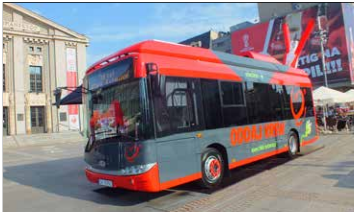
Ambulans - ruchoma stacja krwiodawcza na katowickim Rynku

przygotowania ich autologicznego przeszczepu. Prowadzimy dalsze prace badawcze nad rozwojem nowych technologii, np. opracowaliśmy nowe