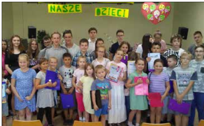
Zakończenie zajęć klubowych w „Józefince”