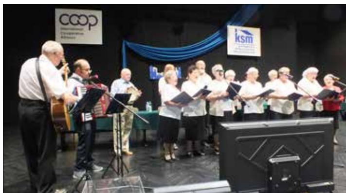
„100-Krotki” umiły oczekiwanie na rozpoczęcie pierwszej części obrad

Bieżące wyniki wszystkich głosowań (dokonywanych przy pomocy elektronicznych terminali – pilotów) wyświetlane były natychmiast na megalokranie i podawane przez Komisję Mandatowo-Skrutacyjną. Sumaryczne wyniki wszystkich głosowań z obu części „Walnego” obliczyło dopiero 28.06. Kolegium Walnego Zgromadzenia i ujęło w swoim Protokole.