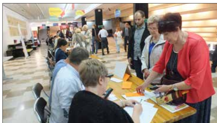
Podpisywanie listy obecności i obiór pilota do głosowań