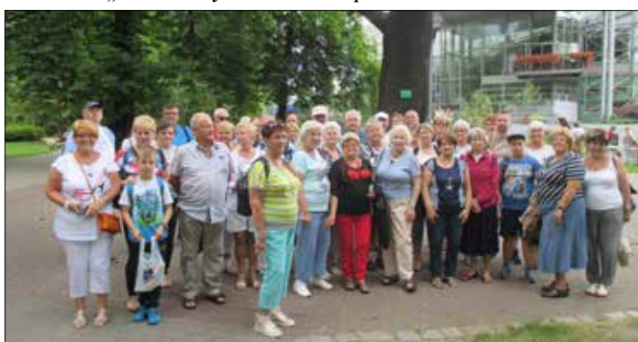
... i do gliwickiej Palmiarni