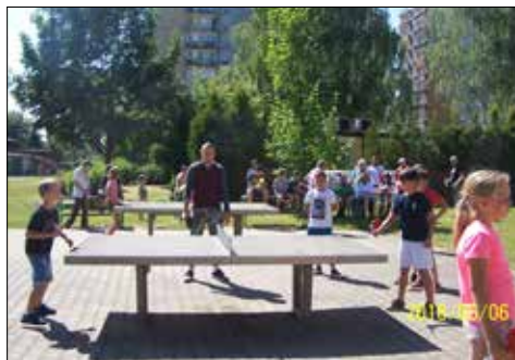
Turniej tenisa stołowego w Szopienicach...