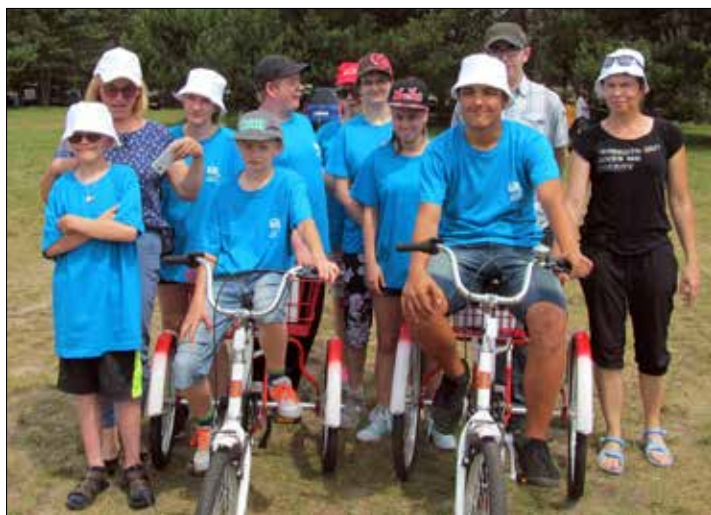
Grupa dzieci z Zespołu Szkolno-Przedszkolnego dla Dzieci Nieusłyszących i Słabo Słyszących przy ul. Grażyńskiego 17 wraz z opiekunkami zaproszona przez KSM