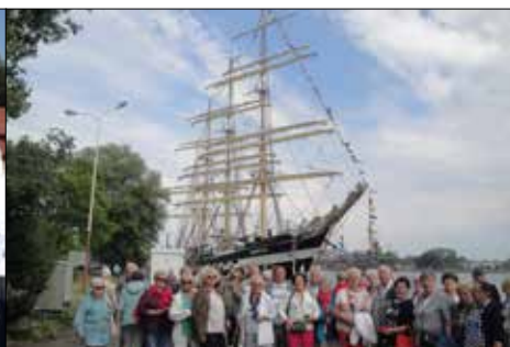
Trzynastkowice i największy żaglowiec świata „Kruzensztern”