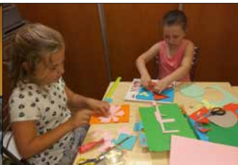
Laurki dla mamy przygotowywane w „Trzynastce”