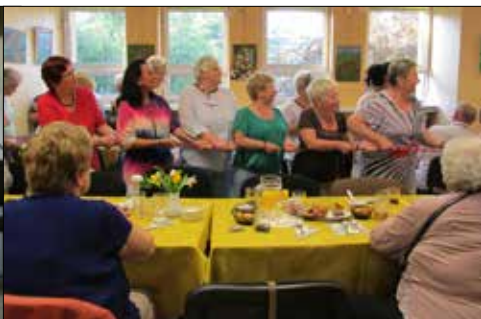
GCK: wspólny Dzień Sąsiada z klubowiczami z „Trzynastki”, „Józefinki” i „Gwiazd”