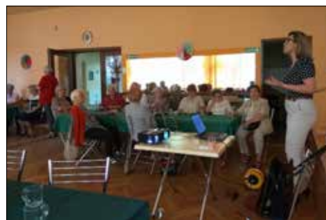
„Trzynastka”: profilaktyka cukrzycy - spotkanie z lekarzem ...