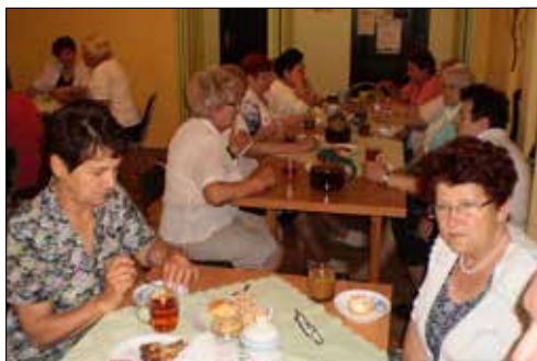
Dzień Matki w klubach: „Centrum”...