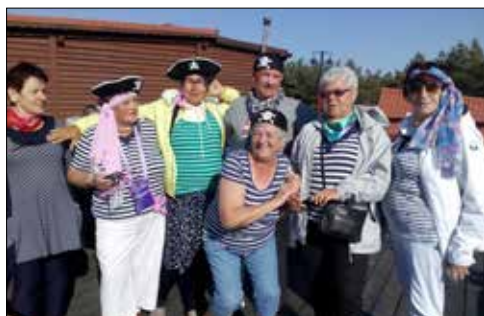
Grupa wesołych piratów na wczasach seniorów w Międzywodziu