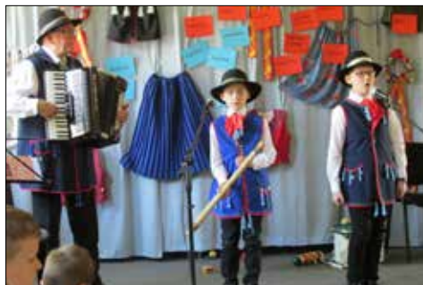
Dzień Regionalny w Giszowieckim Centrum Kultury

Na tradycyjną majówkę wybrała się „Józefinka”. W tym roku jej miejscem była Bolina. 26 osób uczestniczyło w spacerze na świeżym powietrzu. Na koniec apetyty zaspokoili własnoręcznie pieczonymi na grillu kielbaskami.