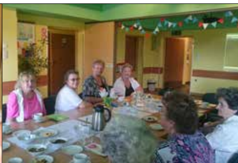
... i „Pod Gwiazdami”