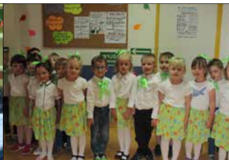
Dzieci z Przedszkola nr 97 występowały w „Juwenui” z okazji Dnia Matki

Ileż piosenek powstało o maju? – wiadomo mnóstwo! I wiadomo też dlaczego: po prostu najpiękniejszy miesiąc to maj! Wszystko kwitnie wokoło i na naszych twarzach też więcej uśmiechu. Przyczynia się do tego nie tylko uroda tego miesiąca, ale także wydarzenia z nim związane. Przede wszystkim Dzień Matki – niekwestionowany, majowy numer jeden, ale również – dla nas mieszkańców spółdzielczych osiedli ważny – Dzień Sąsiada, bo przecież wszyscy jesteśmy sąsiadami! Nasze kluby świętowały więc oba dni, no i rzecz jasna upajały się pięknem przyrody.