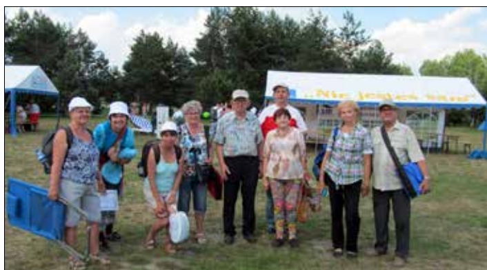
Uczestnicy XVI Pikniku z Katowickiej Spółdzielni Mieszkaniowej

Na placu piknikowym, pod hasłem „Nie jesteś sam”, zgromadziło się około 500 niepełnosprawnych i osób im towarzyszących z 10 spółdzielni mieszkaniowych województwa śląskiego, w tym 15 mieszkańców Katowickiej Spółdzielni Mieszkaniowej oraz 31 uczniów i opiekunów z dwóch katowickich szkół: Zespołu Szkół Specjalnych nr 9 im. Jana Pawła 2 przy ulicy Ściągły 17 oraz Zespołu Szkolno-Przedszkolnego dla Dzieci Nieusłyszących i Słabo Słyszących przy ul. Grażyńskiego 17, często zamieszkujących w zasobach KSM. Osobami kalekimi, inwalida-