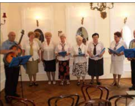
Zespół z klubu „Centrum” występował dla pensjonariuszy Domu Pomocy Społecznej