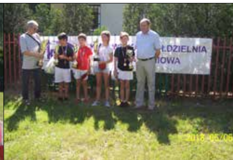
... i jego zwycięzcy wraz z organizatorami