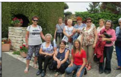
Seniorzy z „Juwenii” byli zachwyceni gozczałkowiickimi ogrodami Kapias