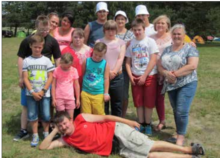
Zaproszone przez KSM dzieci z Zespołu Szkół Specjalnych nr 9 im. Jana Pawła 2 przy ulicy Ściągały 17 w Katowicach wraz z opiekunami