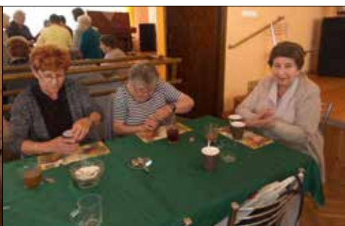
... robienie kul do kąpiel