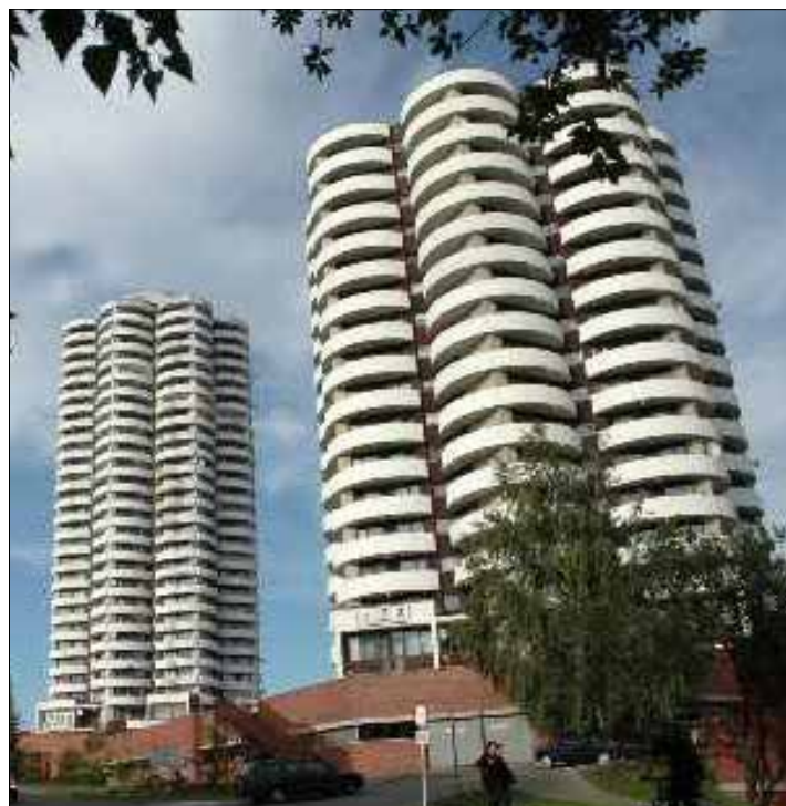
Do zasobów SM Piast należą m. in. popularne Kukurydze

Zawiadomienie o zwołaniu Walnego Zgromadzenia, porządku jego obrad i możliwości zapoznawania się z materiałami na Zgromadzenie otrzymał od Zarządu KSM odrębnie każdy z członków Spółdzielni – niezależnie od informacji podawanych we „Wspólnych Sprawach”.