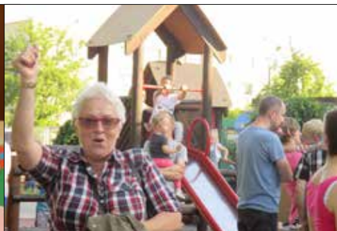
Świetny pomysł „Juwenui” - wspólna plenerowa zabawa z okazji Dnia Matki i Dnia Dziecka