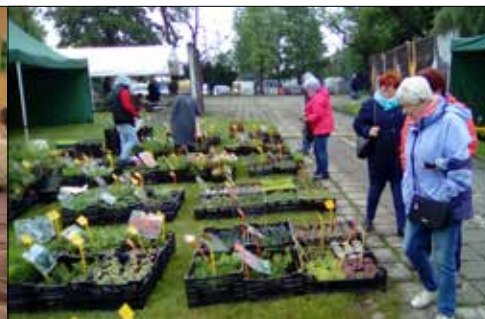
Co by tu kupić na swój balkon - zastanawiały się panie z klubu „Centrum” na wystawie w Parku Śląskim