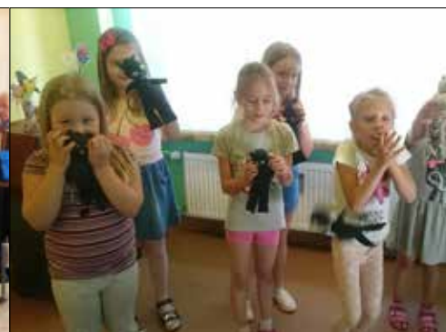
Skarpeciaki - czyli coś z niczego, wyczarowane na warsztatach plastycznych „Pod Gwiazdami”