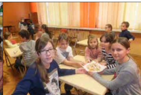
Te faworki, osobiście upieczone, smakowały dzieciakom z „Trzynastki”