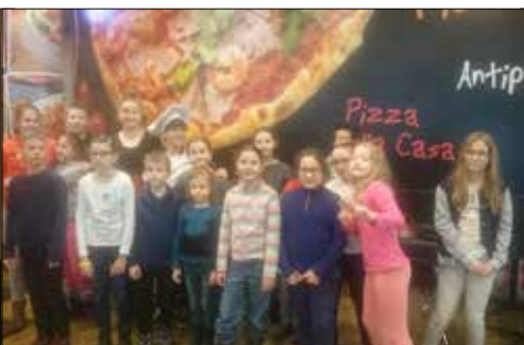
Z klubu „Pod Gwiazdami” zawędrowano do prawdziwej włoskiej pizzerii

Klub „Pod Gwiazdami” zaproponował gry i zabawy klubowe najmłodszym. Odbył się więc konkurs wiedzy o Igrzyskach Olimpijskich, konkurs literacki (wiersze Tuwima i Brzechwy) oraz