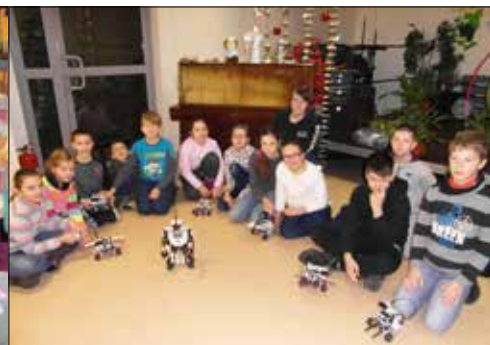
Robotyka na wypasie - to superwydarzenie w „Józefince”