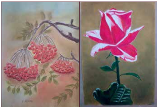
Gałązka jarzębiny i róża – jak żywe – chociaż są tylko „martwą naturą”