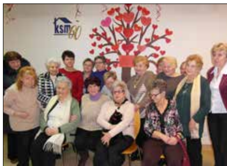
Walentynkowe spotkanie w „Józefince”