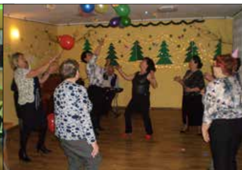
„Centrum”: karnawałowe baloniki...

Za nami już drugi miesiąc roku (w tym czas zimowych ferii), o którym jeszcze ciągle myślimy „nowy rok”. Tymczasem czas pędzi i za sobą zostawia tyle wydarzeń, jakbyśmy mieli za sobą znacznie dłuższy okres, niż tylko styczeń i luty. A czyja to zasługa – nie, że czas nam ucieka, ale że tak dużo już było nam dane przeżyć wrażeń? Tajemnica tkwi w superatrakcyjnym programie wszystkich sześciu spółdzielczych klubów. Kluby nie ustają w staraniach, aby mieszkanie w budynkach Katowickiej Spółdzielni Mieszkaniowej było nie tylko wygodne, ale i jeszcze uprzyjemniane poprzez wydarzenia ciekawe, pouczające i zbliżające mieszkańców.