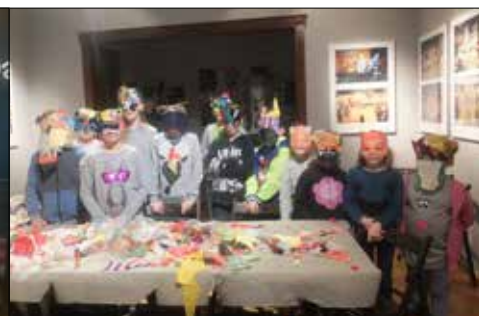
Któż za tymi maskami rozpozna dzieciaki z Zawadzka?

Wiele radości sprawił Noworoczny Bal Przebiezańców. Bawili się bardzo młodzi i bardzo dojrzały, w grach, konkursach i zabawach uczestniczyli bowiem nawet maluchy ze swoimi dziadkami i babciami. Furorę wśród zajęć proponowanych podczas ferii zrobiły zajęcia kreatywne przy zastosowaniu zestawów lego mindstorms pod hasłem „Robotyka na wypasie”. Każdy uczestnik spotkania miał okazję osobiście zbudować robota i uruchomić go przy pomocy komputera lub pilota. Te liczne atrakcje uzupełniły jeszcze bardzo interesujące