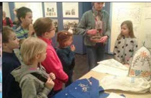
Gwiazdowicze poznają tajniki haftu podczas wizyty w Muzeum Historii Katowic