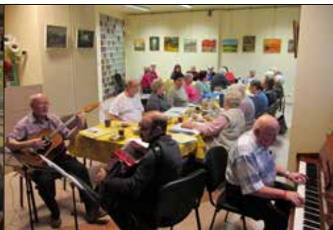
Giszowieckie Centrum Kultury: tusty czwartek z pączkiem i piosenką