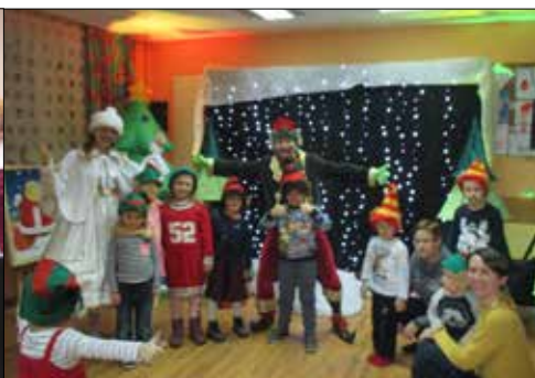
Radosna zabawa w „Juvenii”