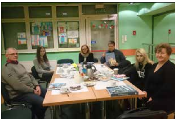
Laureaci konkursu „Osiedle Gwiazdy w obiektywie”

Teraz kolej na drugi z dni, które wyrastają z miłości – tym razem do naszych czworonożnych przyjaciół. „Józefinka” świętowała więc Dzień Kota. W spotkaniu wzięły udział 3 czarne koty,