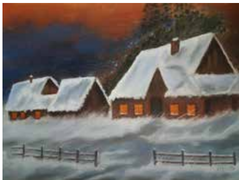
Zimowy pejzaż - chaty w śnieżycy

Wszak onegdaj kończyła Technikum Ekonomiczne w Radomsku. Tylko na rozpoczęte zajęcia trzeba było dosyć długo dojeżdżać. Zdecydowała, iż bliższy (w sensie odległości i zainteresowań) jest Uniwersytet Śląski, na który przeniosła się w semestrze 2016/2017 r. Zapisała się tam i pod-