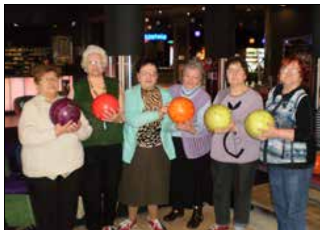
Gra w kregle jest atrakcyjna dla senierek w „Centrum”...