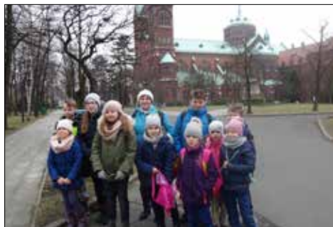
Dzieciaki z Zawonia przed panewnicką bazyliką

Innym razem w ciekawych warsztatach wzięli udział seniorzy z „Trzynastki”. Trudny temat „Namalować niewidzialne” został przedstawiony w przystępny i ciekawy sposób. Prowadząca pani pokazała obrazy przedstawiające Boga, strach,