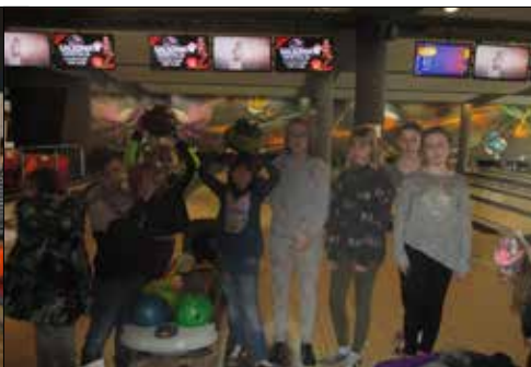
... i dla junierek z „Juvenii”