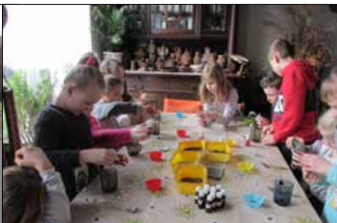
Giszowianie na wycieczce w Bojkowie robili mydła