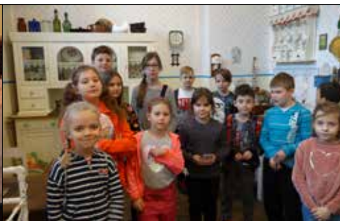
Trzynastkowicze na tle bifyju w Muzeum Historii Katowic