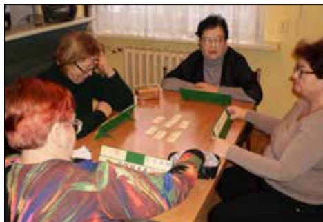
Stolikowe łamiągłówek w klubie „Centrum”