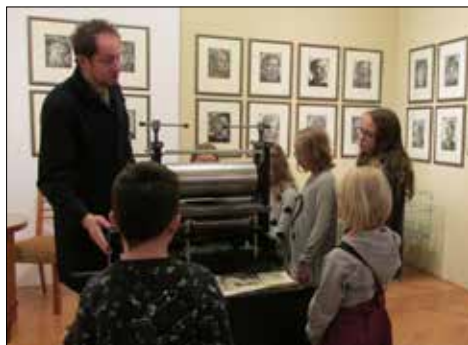
Młodzi giszowianie na warsztatach „Grafika” w Muzeum Historii Katowic